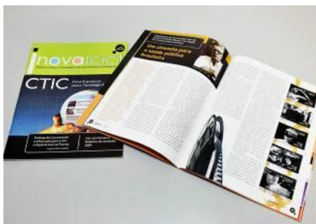
Publicação do ICICT

O núcleo de design do Instituto de Comunicação e Informação Científica e Tecnológica (Icict) colaborou decisivamente com a missão desse instituto de analisar e divulgar informações em saúde por meio de sistemas de informação e plataformas tecnológicas. E ainda, preservar e disseminar o acervo bibliográfico e audiovisual da Fiocruz com um importante trabalho de digitalização de obras raras. Esse núcleo colabora com todas as vertentes do Icict desenvolvendo projetos de livros, publicações, aplicativos eletrônicos, exposições e eventos científicos.