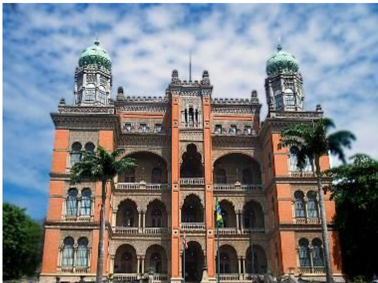
Fachada frontal do Pavilhão Mourisco

Muito antes da utilização do conceito de promoção da saúde, Oswaldo Cruz ergueu o castelo de Manguinhos, entre 1905 e 1918, unindo beleza e funcionalidade. Além de criar o símbolo maior da instituição, contemplou as necessidades físicas e psíquicas relativas ao trabalho de sua equipe – cientistas e técnicos que devotavam seu tempo e sua energia em pesquisas pioneiras de saúde pública. Hoje denominado Pavilhão Mourisco, é um marco em termos de inovações e conforto para a época.