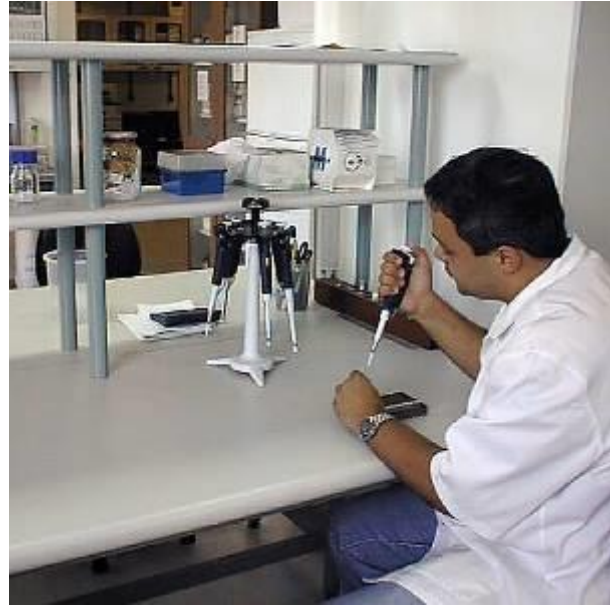
Linha de Mobiliário para Laboratórios: bancadas, armários, castelos

Em 1992, dando como concluída a missão inicial que tinha por base as atividades de projetar e produzir, o setor dedicou-se somente à atividade projetual, passando a denominar-se Serviço de Desenho Industrial. Foram desenvolvidos mais de duzentos projetos, dentre produtos e comunicação visual, dos quais se destacam a Linha de Mobiliário para Laboratórios (bancadas, armários e carros para transporte), a Linha de Equipamentos de Apoio a Pesquisa (suportes para tubos de ensaio e pipetas, recipientes para autoclave, etc.), além da Linha de Equipamentos para Biotérios (gaiolas, racks, viveiros, comedouros, etc.).