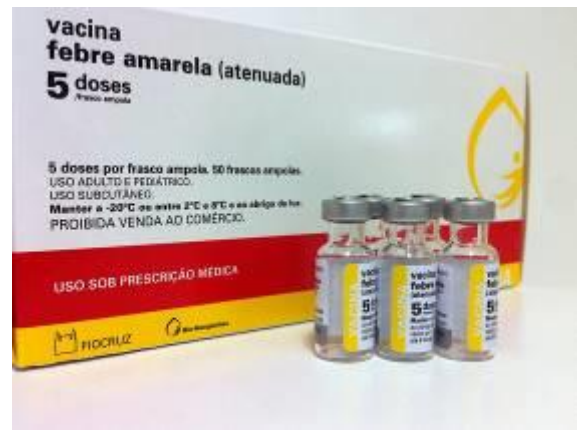
Embalagens de vacinas / Bio-Manguinhos

Um projeto que merece ser citado foi a transformação da página da Fiocruz na internet num portal da saúde. O site possuía um grande número de acessos, mas carecia de informação, design e funcionalidade. Para tanto, um grupo de designers da instituição se capacitou em web design, conceituou e desenvolveu o portal liderado pelo Icict. Em conjunto com analistas de sistema e jornalistas da instituição, implantaram o portal inovador para a época, onde é possível acessar de acordo com o perfil do usuário, seja ele pesquisador, profissional de saúde, professor, aluno ou cidadão. Desde então o portal vem passando por frequentes melhorias, pode-se conferir em www.fiocruz.br