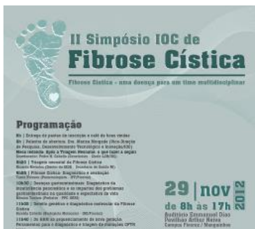
Cartaz de evento científico do IOC