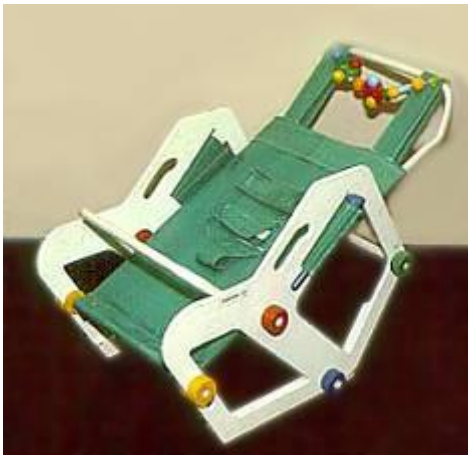
Cadeira Antirrefluxo Gastresofagiano

Em 1992, dando como concluída a missão inicial que tinha por base as atividades de projetar e produzir, o setor dedicou-se somente à atividade projetual, passando a denominar-se Serviço de Desenho Industrial. Foram desenvolvidos mais de duzentos projetos, dentre produtos e comunicação visual, dos quais se destacam a Linha de Mobiliário para Laboratórios (bancadas, armários e carros para transporte), a Linha de Equipamentos de Apoio a Pesquisa (suportes para tubos de ensaio e pipetas, recipientes para autoclave, etc.), além da Linha de Equipamentos para Biotérios (gaiolas, racks, viveiros, comedouros, etc.).