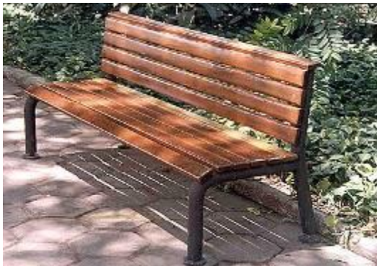
Banco de jardim

A demanda por projetos de design era crescente, e o setor passou a atender a todas as unidades da Fiocruz. Dessa forma, foram projetados também equipamentos médico-hospitalares como a Cadeira Antirrefluxo Gastresofagiano (patenteada, Prêmio Invento Brasileiro 1993), o Berço para UTI Neonatal e a Seringa de Coleta de Sangue de Dupla Via (patenteada), mobiliário urbano para o campus como abrigo de ônibus, banco de jardim, coletor de lixo, poste de iluminação pública e ainda, mobiliário e playground para creche.