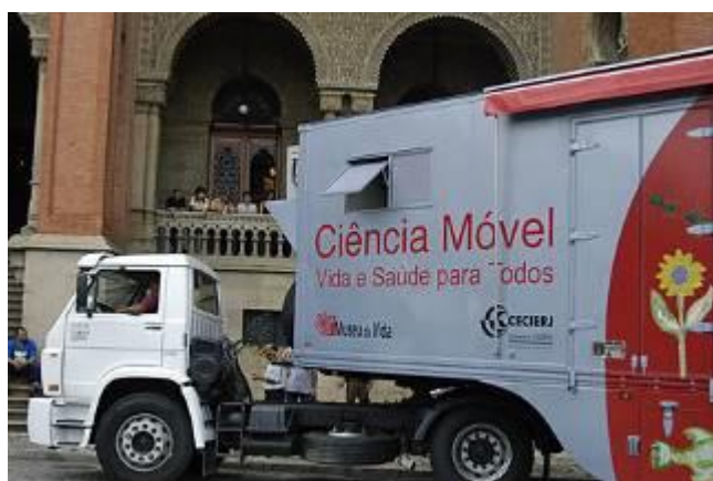
Caminhão Ciência-móvel / Museu da Vida

Já o núcleo de design do Museu da Vida realizou projetos que materializaram a proposta desse museu singular que é informar e educar em ciência, saúde e tecnologia de forma lúdica e criativa, através de exposições, atividades interativas, multimídias e laboratórios. Destacamos o Ciência-móvel que é um museu itinerante que viaja em um caminhão e leva exposições, jogos, equipamentos interativos e outras atividades para municípios da região Sudeste do Brasil.