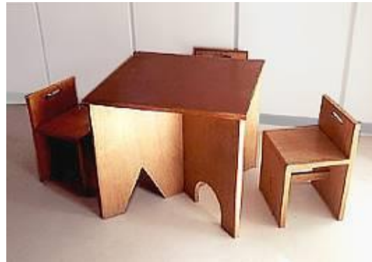
Mobiliário para creche/Fiocruz

Também foi desenvolvido o Sistema de Uniformes da Fiocruz, o Terminal Eletrônico de Consultas Administrativas, o Sistema Modular de Exposições Científicas. Por outro lado, iniciou-se a assessoria na especificação técnica de processos licitatórios de mobiliário laboratorial e administrativo, no sentido de qualificar produtos e fornecedores.