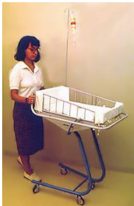
Berço para UTI Neonatal