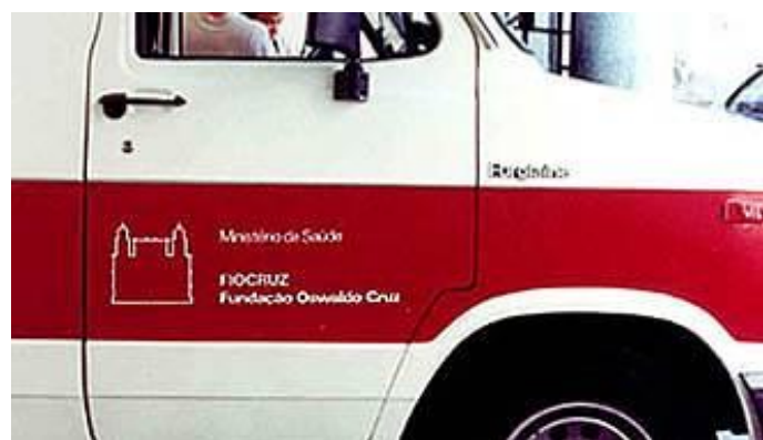
Marca institucional e aplicações