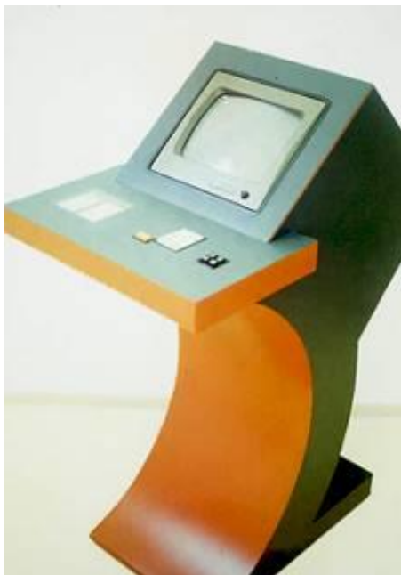
Terminal Eletrônico de Consultas

Também foi desenvolvido o Sistema de Uniformes da Fiocruz, o Terminal Eletrônico de Consultas Administrativas, o Sistema Modular de Exposições Científicas. Por outro lado, iniciou-se a assessoria na especificação técnica de processos licitatórios de mobiliário laboratorial e administrativo, no sentido de qualificar produtos e fornecedores.