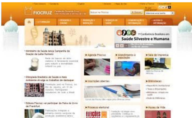
Sítio Fiocruz - www.fiocruz.br

Um projeto que merece ser citado foi a transformação da página da Fiocruz na internet num portal da saúde. O site possuía um grande número de acessos, mas carecia de informação, design e funcionalidade. Para tanto, um grupo de designers da instituição se capacitou em web design, conceituou e desenvolveu o portal liderado pelo Icict. Em conjunto com analistas de sistema e jornalistas da instituição, implantaram o portal inovador para a época, onde é possível acessar de acordo com o perfil do usuário, seja ele pesquisador, profissional de saúde, professor, aluno ou cidadão. Desde então o portal vem passando por frequentes melhorias, pode-se conferir em www.fiocruz.br